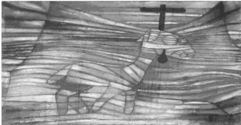
Paul Klee, Das Lamm, 1920, Städel Museum, Frankfurt am Main

D as Lamm steht als Symbol für die Unschuld. Es war zugleich ein klassisches Opfertier, nicht nur im Judentum, sondern auch im griechischen und römischen Glauben, wenn Tieropfer praktiziert wurden. Jesus Christus hat sich am Kreuz als ein solches Opfertier offenbart.